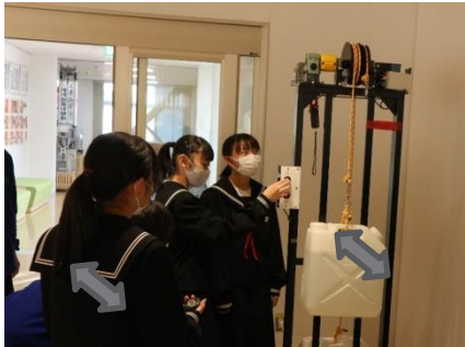
体験①: 重いものを軽く動かす工夫

電力や電力量などのエネルギーの単位の意味を知り、エネルギーを賢く利用することへの興味関心を高めます。