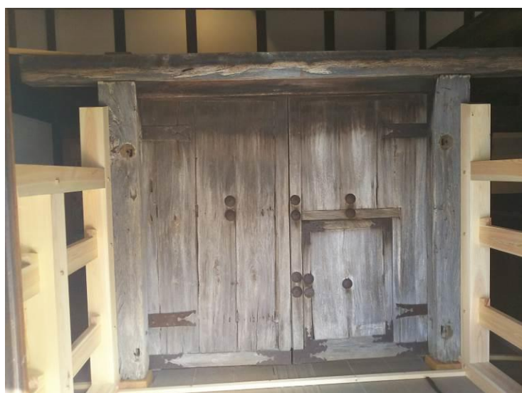
⑱両扉据え付け完了