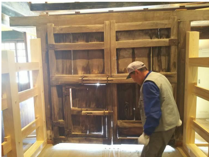
⑱両扉の位置、高さ調整