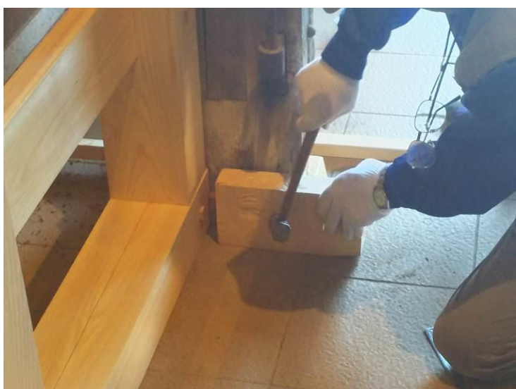
⑪鏡柱根太据え付け