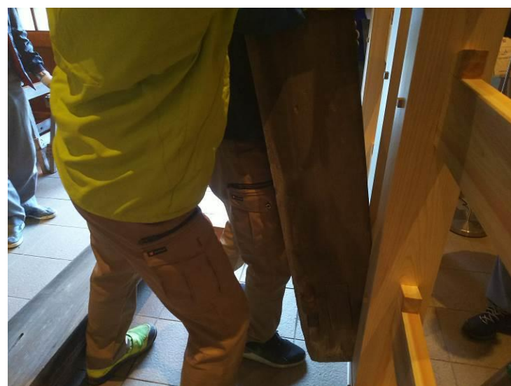
⑥鏡柱を支柱に立て入れ(左)