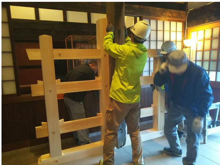
⑦鏡柱を支柱に立て入れ(右)