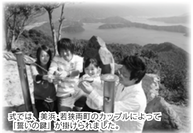
式では、美浜・若狭両町のカップルによって「誓いの鍵」が掛けられました。