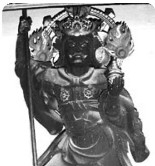
毘沙門天像 水生寺 (河原市) 蔵