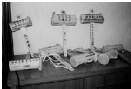
坂尻区「ガリアイ(狐狩り)」の槌