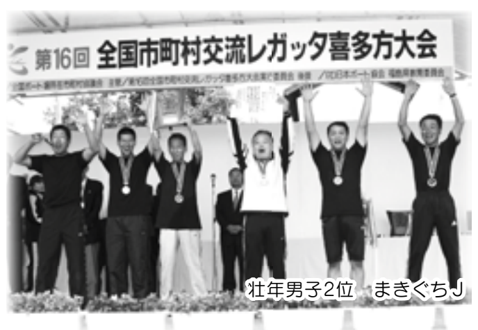
壮年男子2位 まきぐちJ