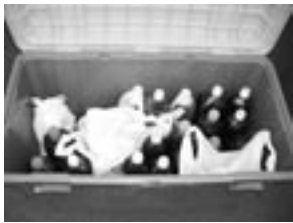
▲各回収場所に設置してある回収BOX