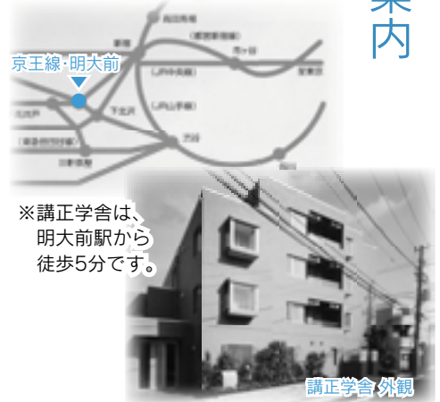
※講正学舎は、明大前駅から徒歩5分です。