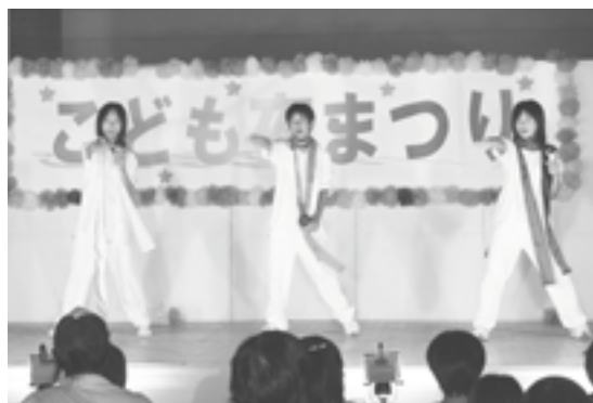
△ テレビでおなじみ「羞恥心」に仮装