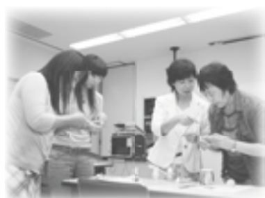
▲風車を作成している様子 (小学校低学年の分科会)