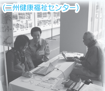
(三州健康福祉センター)

健康診査の結果を入力し、若さが明らか！自分の体の年齢を知っておくことも大切です。