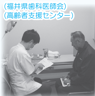
(福井県歯科医師会 高齢者支援センター)