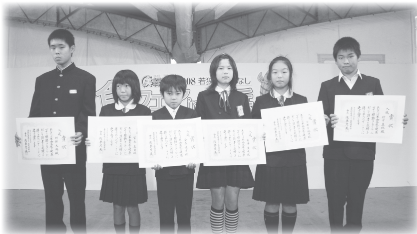
△受賞された皆さん(一部)

入賞された作品は、はあとぴあにて展示し、町の健康指標としても活用させていただきます。