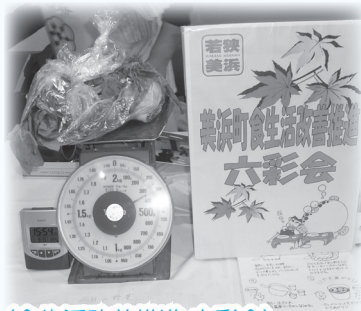
(食生活改善推進 六彩会)