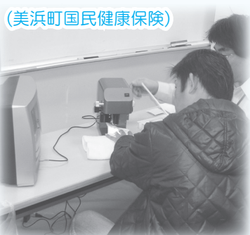
(美浜町国民健康保険)