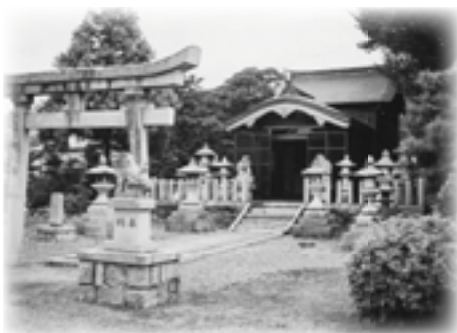
山上神社 石灯籠が多く奉納されている