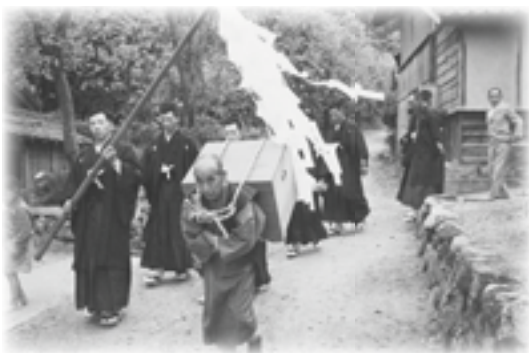
昭和 33 年 織田神社例大祭 獅子を運ぶ太田区の人々