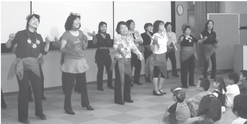
↑息のあった歌とダンスで湖の様子を表現するメンバーら(9月23日の環境イベント) 【あつとほうむにて】