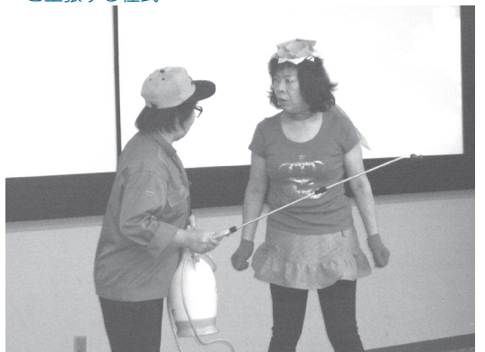
↓カッパに「農薬を使わないと良い作物ができない」と主張する住民

メンバーらは、毎月2回のペースで練習を重ね、今年1月の原平協(福井県原子力平和利用協議会)の「新春の集い」を皮切りに、現在まで3回の公演を行っており、方言などを盛り込んだ熱意とユーモアあふれる演技で多くの観客を魅