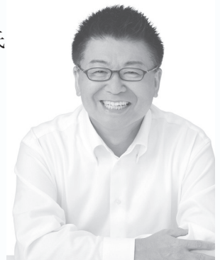
生島 ヒロシ 氏