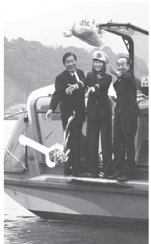
↑黄金の鍵・花束の投湖

美浜・若狭の両町長や観光関係者らが出席した式典では、山頂で願い事が叶うといわれている「かわらけ投げ」が、湖では「黄金の鍵と花束の投湖」が行われ、1年の賑わいと安全を祈願しました。