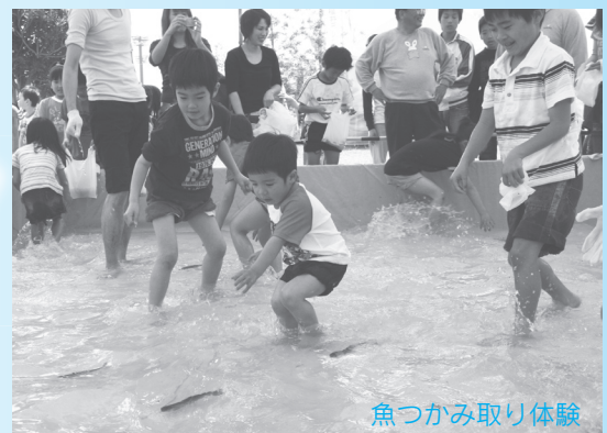
魚つかみ取り体験