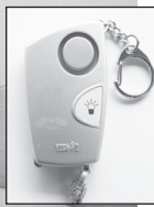
↑贈呈された防犯ブザー