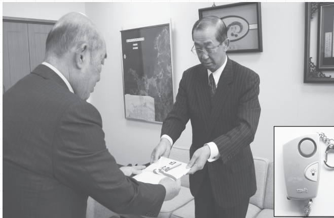
↓中村本部長(右)から目録を受け取る大同教育長(左)