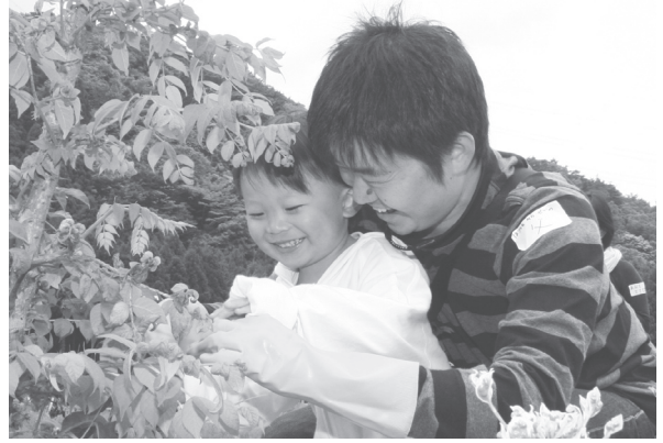
↓笑顔で「タラの芽」を摘む親子（さくらんぼひろば）

7月には父親ならではの子育てに関するお話、10月には親子ふれあい遊びを計画しています。子どもとの関わり方や育児参加の方法について学んでみませんか。