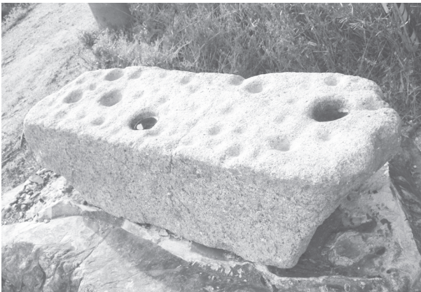
織田神社の参道近くに置かれた「盃状穴」（佐田）