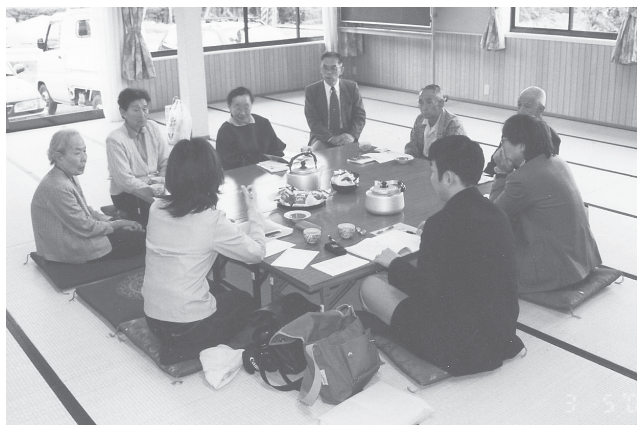
北田集落センターでの民俗調査（平成13年）