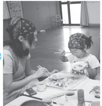
④おいしいミックスピザの出来上がり！