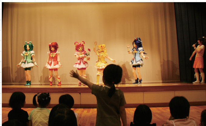
↓ステージ上のキャラクターに手を振る児童

参加者は、美浜の自然や歴史を通して感じとったことをノートに書き留める等して、短歌の題材を探っていました。