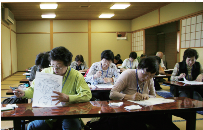
↓久音寺で写経・写仏を体験する参加者