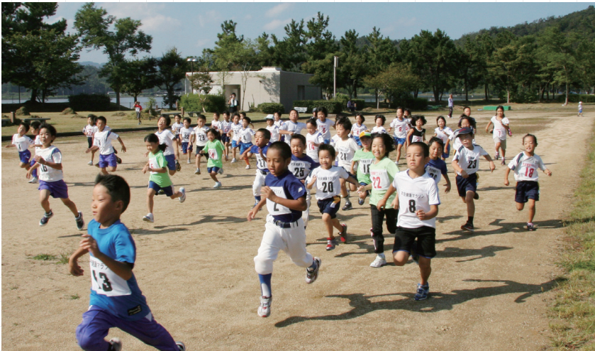
↓元気にトラックを駆け抜ける子どもたち（小学生1・2年の部）