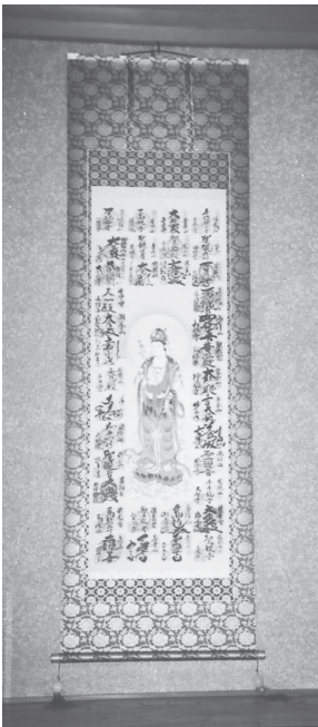
↑若狭三十三ヶ所観音霊場掛軸