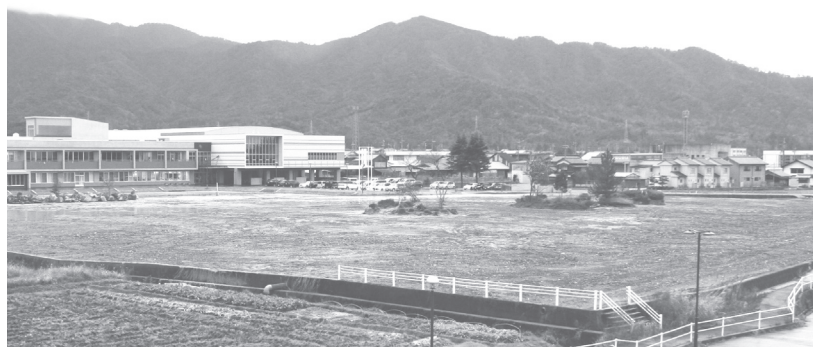
今年8月の完成に向け工事を進めている美浜中学校のグラウンド