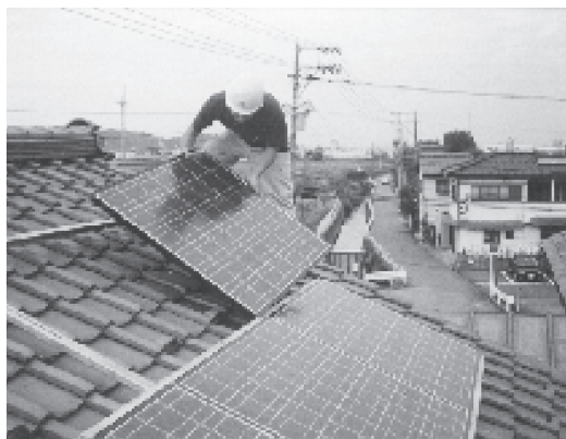
既存住宅の屋根に設置する太陽電池パネル

太陽光発電装置の設置によって削減できるCO 2 の排出量は、1年間に約1.5トンで、通常一般家庭で排出される約6トンの排出量の約25%が削減されることになります。