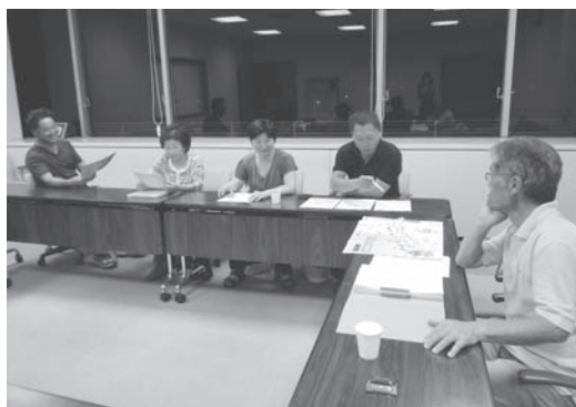
↑わがまち自慢委員会の会議