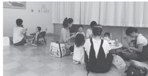
↑ランチタイムを楽しむ親子

楽しい雰囲気にも、いつもはあまり食べないお子さんの食が進むこともあるんですよ。ぜひ、一度センターにお弁当を持ってきて、お家の方同士でおしゃべりしながら、楽しいランチタイムを過ごしてみませんか？