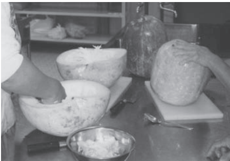
↑金山区の祭礼で調理されるカモウリ