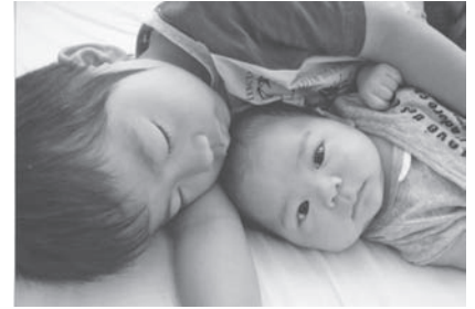
↑平成22年度入賞作品