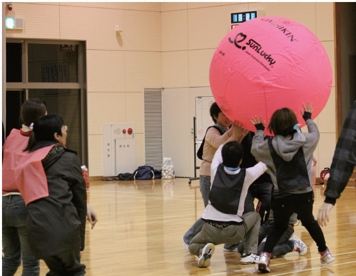
↑ ニューススポーツで交流を深める参加者たち