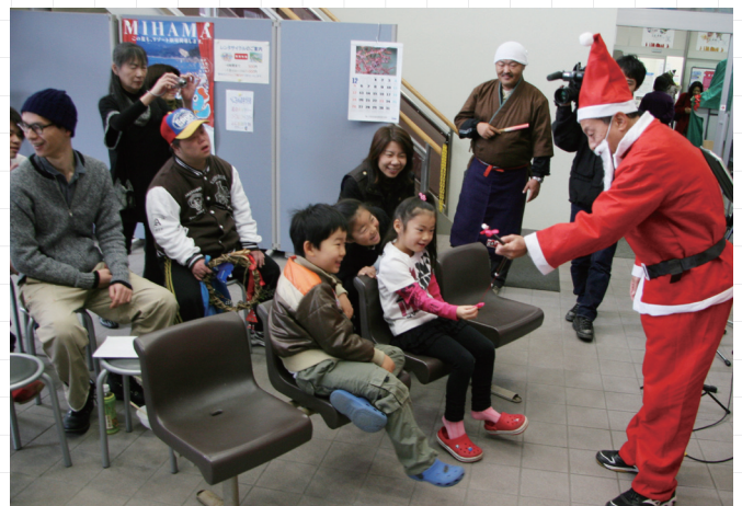
↑ マジカルヤマザキさんの手品に子どもたちはビックリ!

また、まつりの最後には、小浜線利用促進協議会がピンゴ大会を行い、来場者に小浜線の利用を呼びかけました。