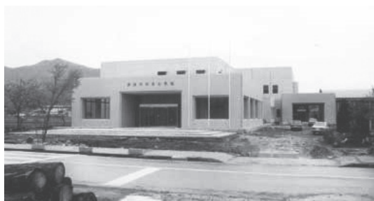
↑昭和52年頃の中央公民館

昭和52年4月に開館して以来、結婚式や青年団活動、成人式、各種団体サークル活動等、町民の皆さんにはさまざまな形で中央公民館をご利用いただき、本当にありがとうございました。