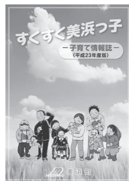
携帯しやすいA5サイズです!

お子さんがいる世帯のほかにも、町外で所帯を持たれているお子さん、お孫さんにも美浜町の子育て支援事業をぜひお知らせください。