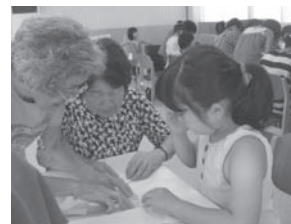
↑折り紙でワンピース作り

当日会場には、「本のリサイクル」や「本のお医者さん」、「何ができるかな楽しい折り紙」、「押し花でしおりをつくろう!」等のコーナーが設けられ、たくさんの人で賑わいました。折り紙に夢中になり、時間終了まで折り続ける大人や、「本がなおったよ～」と嬉しそうに話す子どもの姿がとても印象的でした。