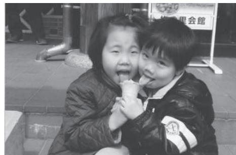
↑平成23年度入賞作品