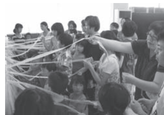
↑何が当たるかドキドキのくじ引き

現在は長期休館中で大変ご迷惑をおかけしていますが、11月3日(予定)の新館オープンを楽しみにお待ちしております。