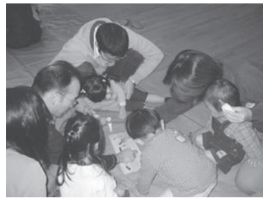
← パパと一緒に 木工工作に挑戦