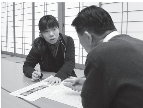
↑自宅に訪問し、保健指導を行う町の保健師。生活習慣の改善が必要な方にはアドバイスをしている。

健康づくり課では、健診の実施だけでなく、健診後には保健指導を行っています。健診結果についても、保健師が相談にのり、食事や運動等の生活習慣を見直すことで、改善につながっていきます。 健診や健診結果で分からないことや不安なことがありましたら、健康づくり課までお気軽にお問い合わせください。