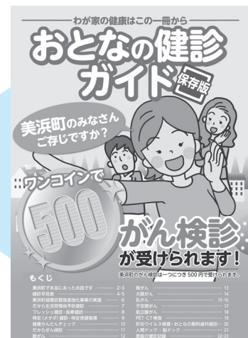
↑健診ガイドブック