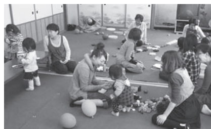
← 子どもたちがのびのびと遊ぶミニさくらんぼ