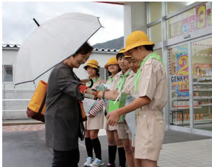
緑の募金で地球温暖化を防ごう