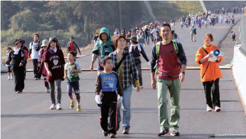
↓建設中の舞鶴若狭自動車道（興道寺～麻生・約2km）を歩く参加者