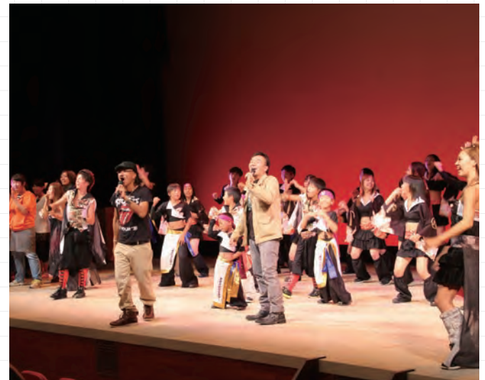
講演&ダンスライブ