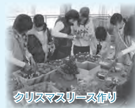
クリスマスリース作り