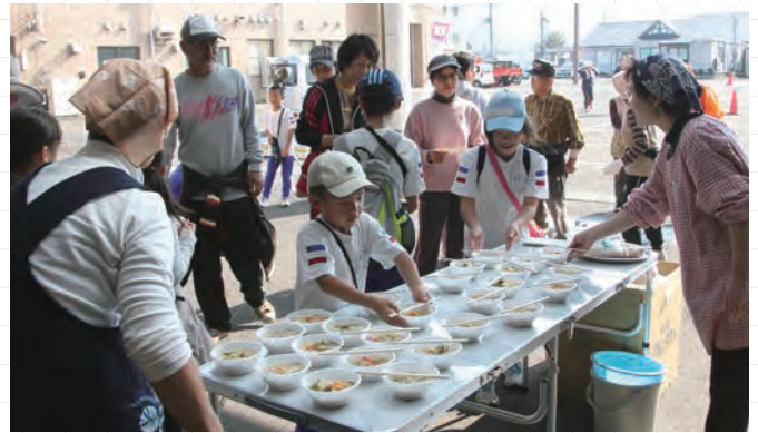
↑食生活改善推進員による減塩みそ汁の振る舞い

また、ゴール後には「げんげん運動」の一環で、食生活改善推進員が貝だくさんの減塩みそ汁を振る舞い、参加者はウォーキングの疲れを癒していました。