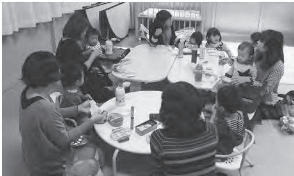
↑ランチタイムを楽しむ親子

保護者の皆さんからは「センターでご飯を食べてからもうひと遊びすると、子どもは帰る途中で寝てしまい、お昼寝もぐっすりなんです。」という声をお聞きます。