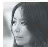
河瀬 直美氏 (映画監督)