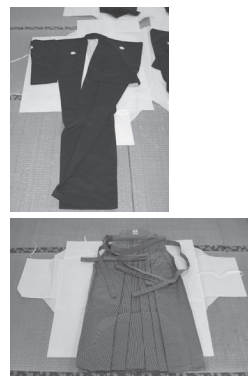
↑祭礼用備品類(袴、羽織、袴等)