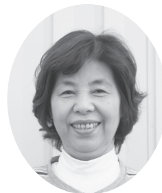
三好多喜恵氏 (郷市)

相談は無料で、秘密は堅く守られます。子育ての悩みや疑問、日頃感じているちょっとしたことでも、お気軽にご相談ください。