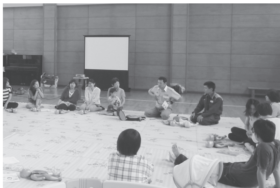
↑昨年度の「救急救命士のおはなし」