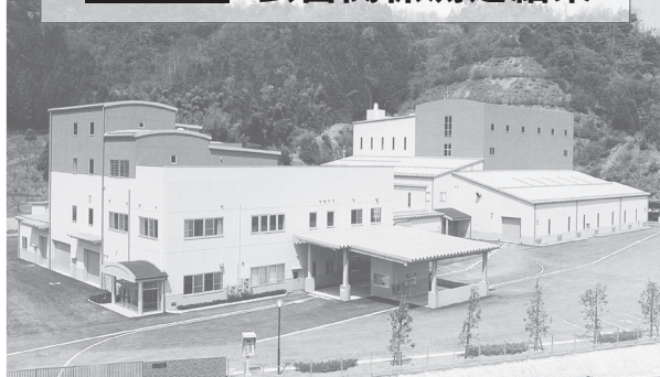
↑エコクル美方(右奥がガス化溶融施設)

エコクル美方「ガス化溶融施設」の平成24年度の稼働実績は、定期修繕工事等に伴う約2か月の運転停止期間はありましたが、当初の年間運転計画に基づいて予定どおり運転を続けることができました。