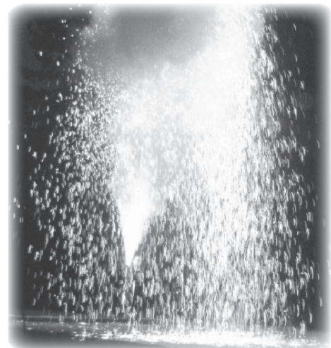
↑大迫力の手筒花火

美浜町の夏を彩る一大イベント! 町民参加型のイベントとしてステージイベントや屋台、物販等を行います。 また、今年からは大迫力の手筒花火がメイン。夜空に上がる火の粉のシャワーを是非お楽しみください。