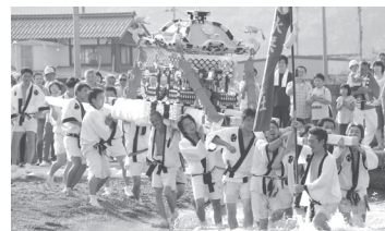
↑水無月祭(おおい町)

福滋県境交流促進協議会は、嶺南6市町と滋賀県湖北・湖南の3市(米原市・長浜市・高島市)で構成される協議会です。協議会では、県境を越えて交流を深め、各市町間で連携・協力することで、相互の魅力あるまちづくりを進めています。