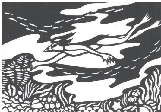
↑「著す・伝える」掲載の切絵(小畑弘氏作)