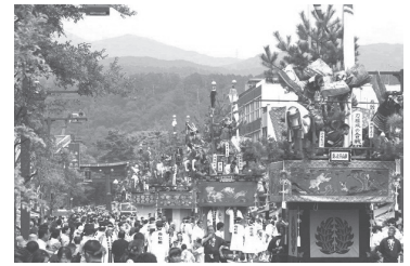
↑敦賀まつりの山車巡行の様子 (敦賀市)

協議会では、県境を越えて交流を深め、各市町間で連携・協力することで、相互の魅力あるまちづくりを進めています。