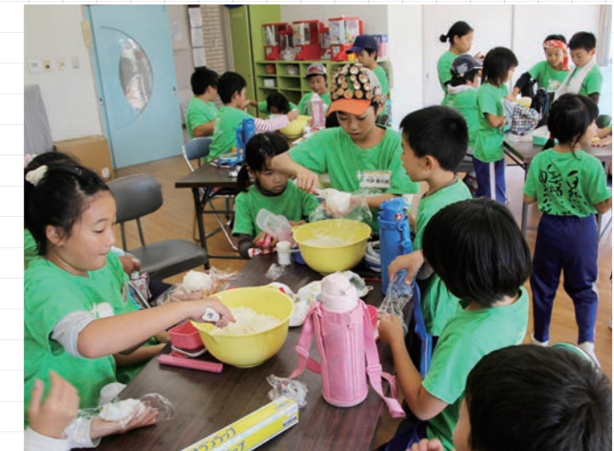
↓飯ごうで炊いた新米をおにぎりにする子どもたち