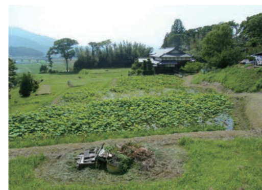
↑弥美神社周辺に残る寺坊跡と考えられる地形

美浜町では「山寺」の遺跡やその様子について詳しくはわかっていませんが、宮代地区の弥美神社周辺に「山寺らしい」景観を見出すことができそうです。「王の舞」で知られる弥美神社の隣には、高野山金剛峰