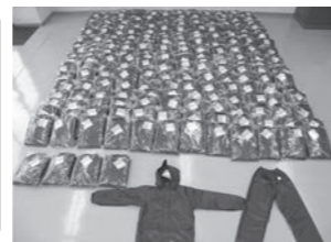
↑ 整備した防寒衣 (233 着)