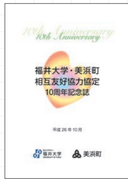
←10周年を記念しこれまでの成果をまとめて作成した記念誌（町ホームページに掲載）