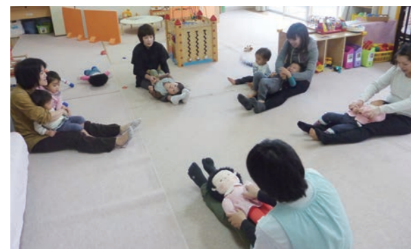
↑楽しみながらスキンシップを図る親子

乳 児期は、身近な大人とのふれあいが大切 です。肌のふれあいはもちろん、優しく大切 に思う心を持ち、目と目を合わせてほほ笑みかけ ながらスキンシップを持つことで、心と体の発達 が促されるとともに、大人との情緒的な絆と信頼 関係がはぐくまれます。