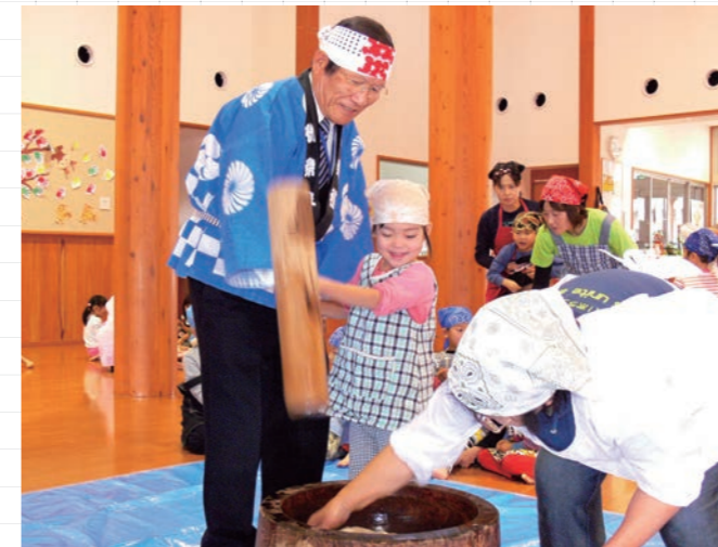
↓山口町長と餅つきを楽しむ子どもたち