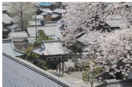
↑映画「サクラサク」ロケ地