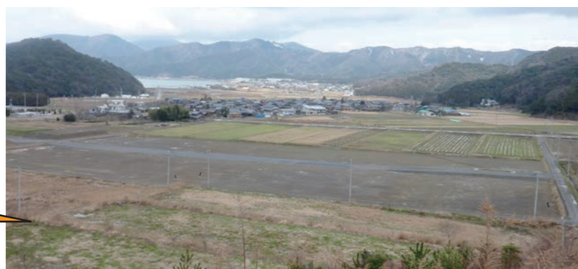
↑新産業団地の整備地(山上)