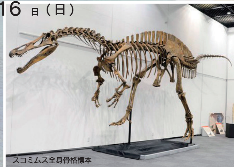
スコミムス全身骨格標本

内容 福井県恐竜博物館コレクションを嶺南初公開。 「スコミムス」をはじめ、24体の全身骨格標本や本物の化石等、大迫力の恐竜展です。