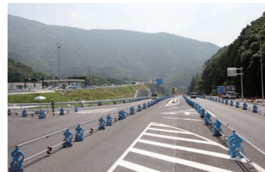
↑4車線化となる美浜東バイパス

さらに、6月25日に美浜東バイパスの4車線化も完成し、合わせて渋滞緩和に大きく寄与することが期待されています。