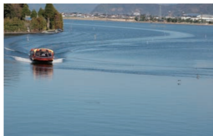
↑三方五湖ジェットクルーズ