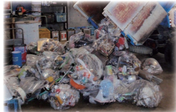
↑鍋、スプレー缶、照明器具、工具等の金属類や、茶碗、コップ、花瓶等の陶器・ガラス製の不燃ごみ