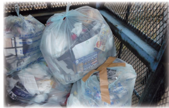
↑紙くず、木くず、草木、発砲スチロール、革製品、ゴム、ビニール製品、綿製品等の可燃ごみ