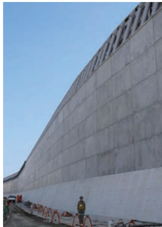
↑ 沿岸に整備された防波壁

次に視察した瑞浪超深地層研究所では、冒頭、原子力発電所で発生した使用済燃料を再処理することで発生する高レベル放射性廃棄物の処分方法、また、当研究所で進める地層処分に関する研究内容について説明を受けた後、採掘現場を視察しました。 当研究所では、地層や岩盤の分布や地下水の流れ方、水質、岩盤の硬さなどを把握する調査技術とともに、地下深部に研究坑道に類似する