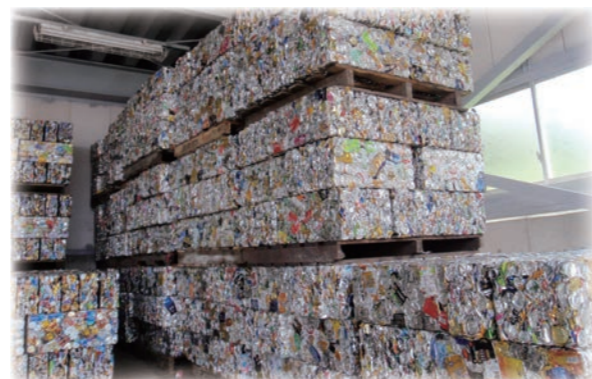
↑缶やペットボトル等の資源ごみ