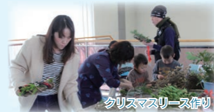
クリスマスリース作り

内容 ・クリスマスリース作り ・チョコアート体験 ・花苗プレゼント ・音楽ライブ(和太鼓等) ・各種出店(豚汁、焼き芋等) ・ガラガラ抽選会等