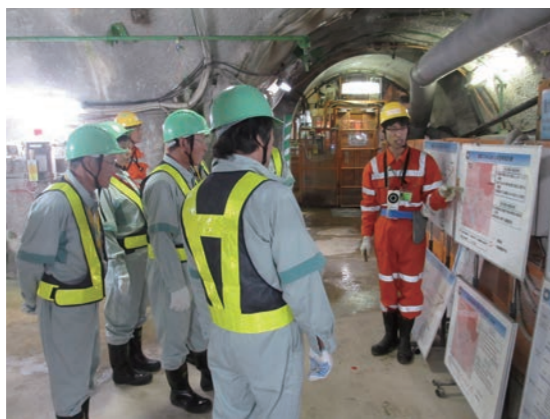
↑ 地下300mにおける調査研究内容の説明を聞く委員

原子炉領域周辺設備の解体撤去(第2段階)が行われていました。 また、浜岡3号機については、新規制基準に対応するための安全性向上対策が着々と進められており、沿岸には南海トラフ巨大地震に起因する津波に備えた防波壁(海抜22m・総延長約1.6km)の整備とともに、万が一の津波により、構内に設置している取水槽から、海水が溢水しないようにするための対策(取水槽の周囲に高さ約4mの防止壁の設置)等が行われていました。