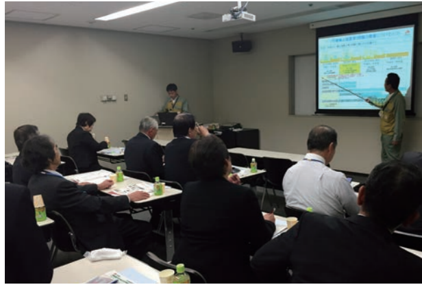
↑ 浜岡1・2号機の廃止措置スケジュール等の説明を聞く委員

町原子力環境安全監視委員会は、10月27日と28日の2日間、委員会活動を進めていく上での参考とするため、廃止措置作業に着手している「中部電力(株)浜岡原子力発電所」と、高レベル放射性廃棄物の地層処分研究をしている「国立研究開発法人日本原子力研究開発機構瑞浪超深地層研究所」を視察しました。 浜岡原子力発電所では、冒頭、浜岡1・2号機の廃止措置のスケジュールやその作業内容、また、浜岡3号機における新規制基準に対応するための安全性向上対策について説明を受けた後、現地を視察しました。