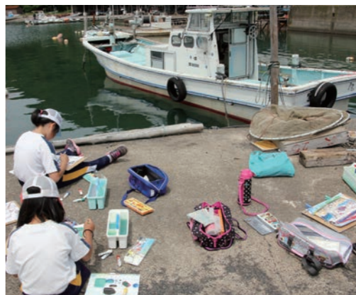
↑ 菅浜漁港の船を写生する児童

また、実施にあたっては、スポーツ少年団等の活動日との調整を行い、土曜授業と活動日が可能な限り重ならないように土曜授業の実施日を設けました。