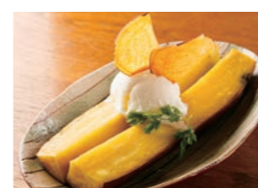
揚げかつま芋パニラ