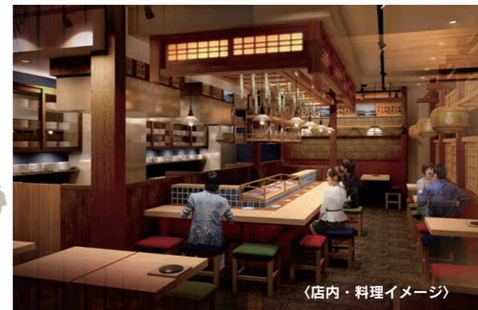
(店内・料理イメージ)