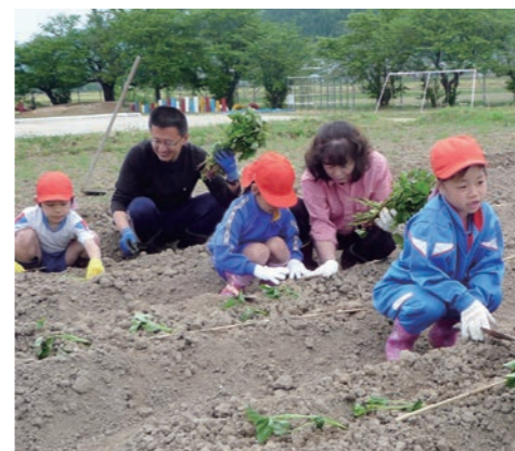
↑ サツマイモの苗を植える児童

稲刈り・魚さばき等を行うことにより、地域学習としてエネルギー環境教育について学び、ふるさとに誇りを持ち愛する心を育てます。 【キャリア教育】 地域の中のいろいろな職業や身近な福祉施設について調べ、働くことへの理解を深めるとともに、高齢者や障がい者の福祉と人権について学び、地域において自立し貢献できる自分らしい生き方を目指します。