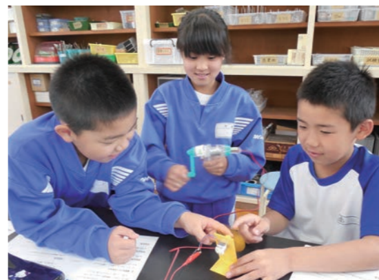
↑ 手回し発電機でエネルギーについて学ぶ児童

課題解決学習、読書習慣の向上を図る全校読書、学習発表会や運動が好きな児童・生徒の育成を図り、一人ひとりの可能性を伸ばします。