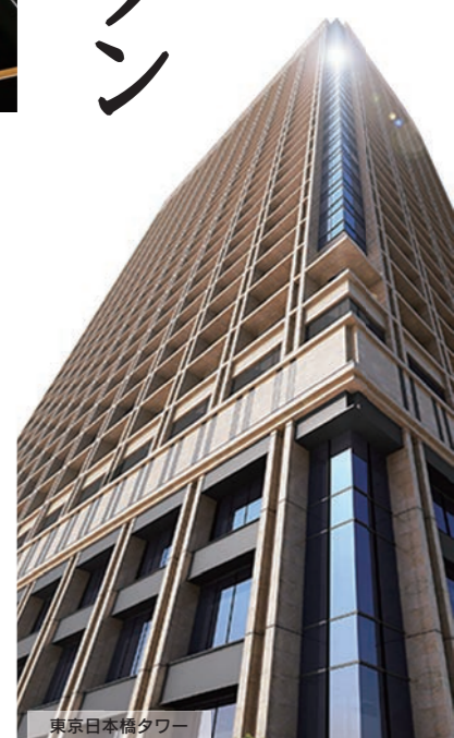
東京日本橋タワー