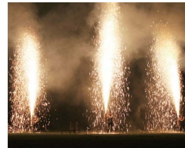
↓大迫力の手筒花火

当日は、保存会のメンバーや区民ら約30人が集まり、しなせられた竹と木の土台を組み合わせた骨組みの作成や、骨組みに和紙を貼る作業を行いました。