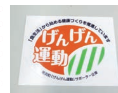
↑サポーター企業に掲示されるステッカー

●「げんげん運動サポーター企業」とは町内に拠点を置き、広く町民及び従業員・会員等に「げんげん運動」の普及啓発と実践のための支援をする企業・団体（飲食店及び食料販売店を含む）です。