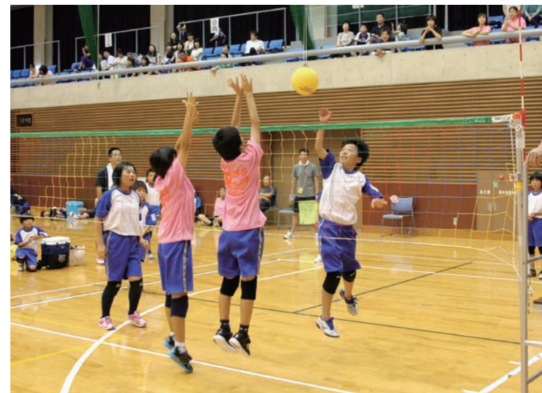
↓熱戦を繰り広げる子どもたち