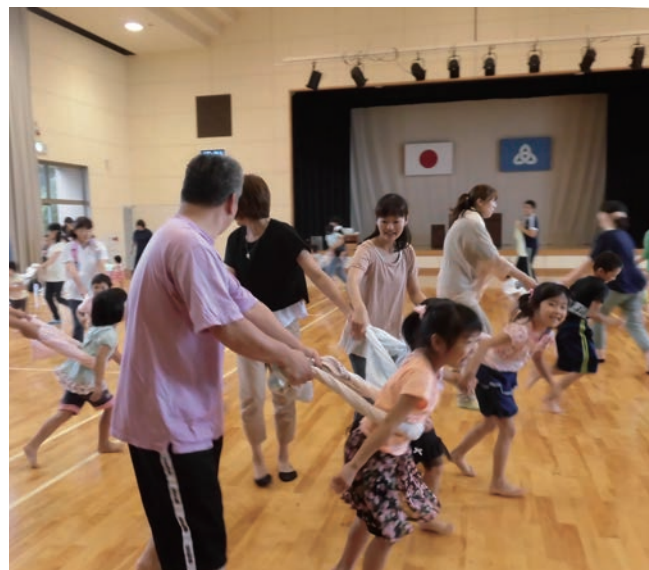
↓思い思いに身体を動かす参加者たち

茶屋では、ドライバーに啓発チラシと飲み物を手渡しながら安全運転を呼び掛けました。