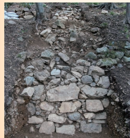
↑発掘調査で見つかった山の上の段石垣

国吉城址の発掘調査では、大量の土砂の下で、麓の城主居館跡から立派な石垣や御殿跡が見つかり、城山の上でも数段に渡って築かれた石垣や、「鏡石」という大名権力の象徴となる大石を備えた門跡が見つかり、本丸跡の一段高い土壇上で礎石を抜き取った痕跡が確認され、いわゆる「天守」も建っていた可能性が高いことが判りました。そして、これらの痕跡は人為的に破壊されたことも判りました。