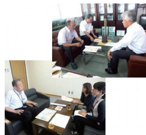
↑サポーター企業を訪問する健康づくりワーキング部会委員