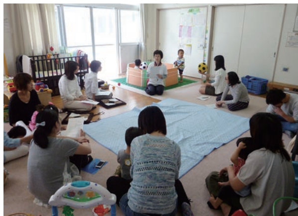
↑言葉に関する悩みを言語聴覚士に相談する参加者

門家である言語聴覚士との相談会を、年3回開催しています。6月に開催された1回目の相談会では、「よその子はあれだけしゃべるのに、うちの子はどうして？と比べてしまう」「言葉が不明瞭で子どもの思いを理解してあげることができずにイライラしてしまう」「なんで？なんで？と聞いてくる子どもの返事に困る」等、さまざまな悩みについての相談や、「自分だけが悩んでいたのではないことを知れた」「同じ悩みを持つ人と情報交換ができて良かった」等の感想がありました。