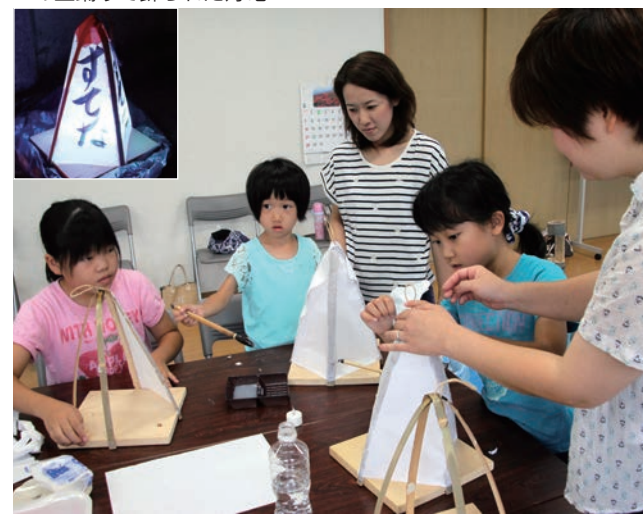
↓8月13日、15日、17日 の盆踊りで飾られた灯籠 ↓灯籠の骨組みに和紙を貼る参加者

参加した小・中学生及び保護者18人は、指導を受けながら、熱心にボートを漕いでいました。