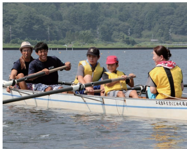
↓指導者と力を合わせてボートを漕ぐ児童

山口町長は、「町民の皆さんの健康づくりや体力向上に、本施設を大いに活用してほしい」と話しました。