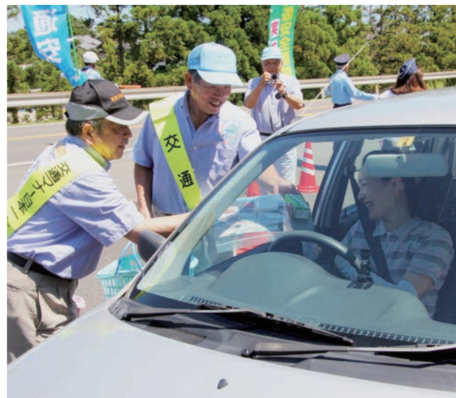
↓啓発チラシと飲み物を配布する敦賀交通安全協会美浜支部