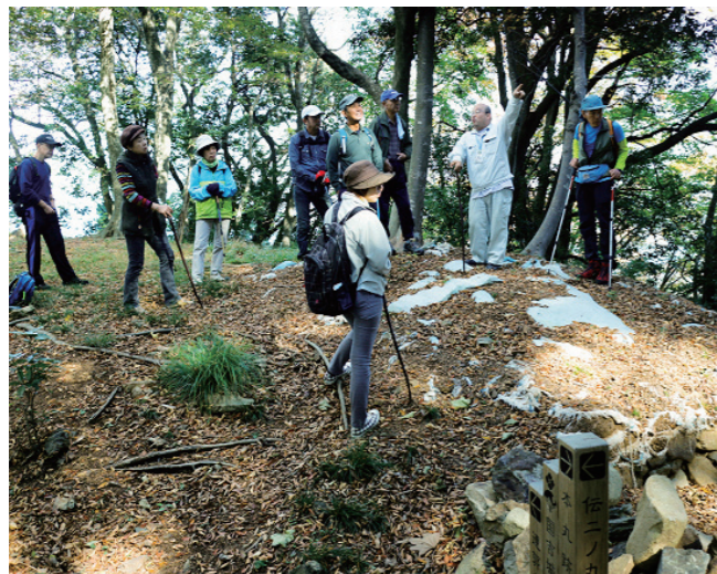
↓国吉城址を見学する参加者

11月12日に、若狭瓦工組合による屋根瓦の無料診断が行われました。 この奉仕活動は、一人暮らしの高齢者を対象に、普段自分ではできない屋根瓦の点検や修繕を行うものです。 当日は、50人の高齢者から点検依頼を受けた組合員13人が、町内各所で瓦の差し替えや棟の積み替え等の作業を行いました。