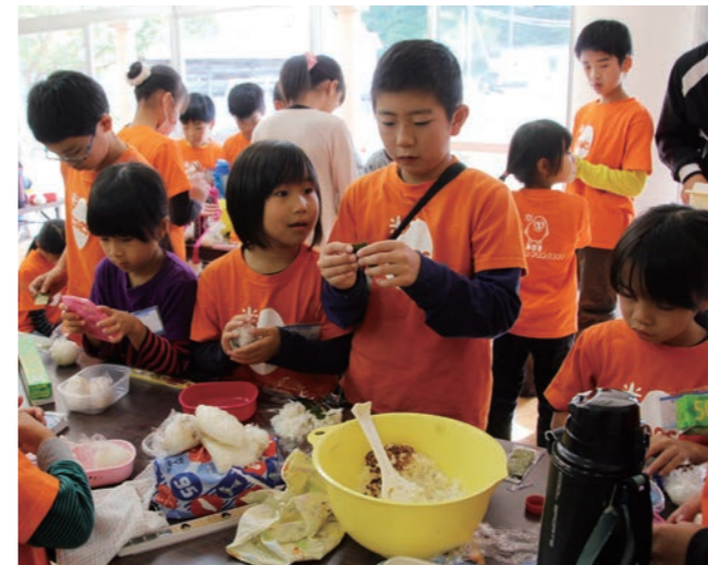
↓炊き立ての新米でおにぎりを作る子どもたち

11月12日に、若狭美浜インター産業団地隣の山林に整備している美浜「美しの森」公園(仮称)への桜の記念植樹が行われました。 これは、美浜ライオンズクラブの創立50周年やライオンズクラブ国際協会の創立100周年、2年後の「福井しあわせ元気」国体・大会の開催を記念して行われたものです。 当日は、町内外の家族や団体、事業所等27組約100人が参加し、桜の苗木を支柱で固定し土をかける作業を行いました。