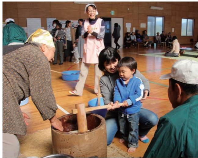
↓地域の方と餅をつく親子

11月13日に、「歴史ハイキング 戦国時代にタイムスリップ」と題した催しが国吉城歴史資料館と御岳山で行われました。 この催しは、町の歴史への理解を深めてもらおうと美浜町生涯学習まちづくり委員会が実施したものです。 当日は、国吉城歴史資料館で国吉城について学んだ後、御岳山を登り、山頂から眺める風景を楽しんでいました。