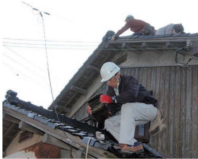
↓瓦の差し替え作業を行う若狭瓦工組合員