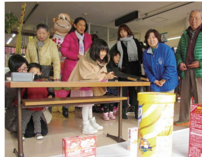
↓大人気の射的ゲームを楽しむ子どもたち

2人の射手が「ヤリマシト」と叫びながら6本ずつ矢を放ち、的から大きく外れた矢は、矢拾い役が的に突き刺し神事を締めくくりました。