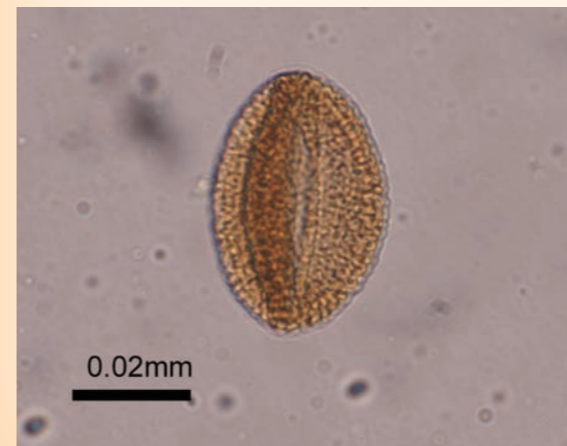
↑ 興道寺廃寺検出のソバ属の花粉写真

興道寺廃寺ではこの数年、寺域を確認するための発掘を継続して行ってきましたが、平成二十六年の発掘でようやく幅1m程の本格的な溝跡が発見されました。考古学の成果によって寺域の西端の場所も分かり、溝で寺院の中と外を区画していた様子が見えてきました。 古くは、この数年、寺域を確認するための発掘を継続して行ってきましたが、平成二十六年の発掘でようやく幅1m程の本格的な溝跡が発見されました。考古学の成果によって寺域の西端の場所も分かり、溝で寺院の中と外を区画していた様子が見えてきました。