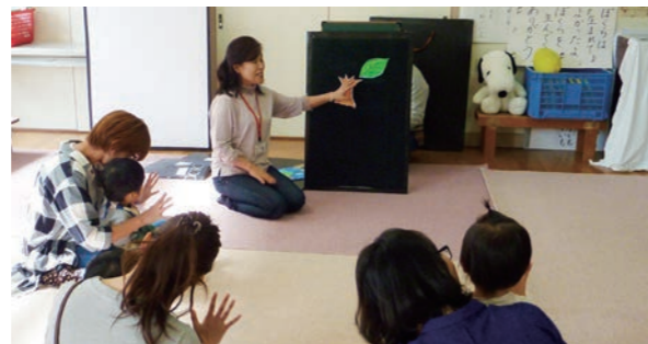
↑パネルシアターを演じるボランティアの方

絵本の読み聞かせ、折り紙講座、行事のお手伝い等、どんなことでも大歓迎です。子どもの好きな方、得意なことを役立てたい方、何かやってみたい方は、ぜひ一緒に子育てを応援してください。