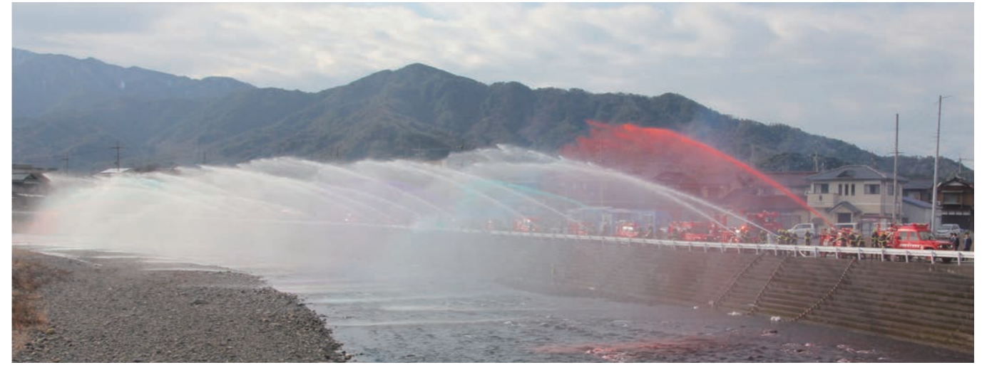
↓耳川に向けて一斉放水を行う美浜消防団員

このイベントは、日向地区の水中綱引き関連イベントとして毎年開催されているもので、当日は、みはま餅つこ隊による餅つきや餅のふるまい、射的、嶺南地域の特産品販売等が行われ、訪れた家族連れや観光客は、さまざまな催しを楽しんでいました。