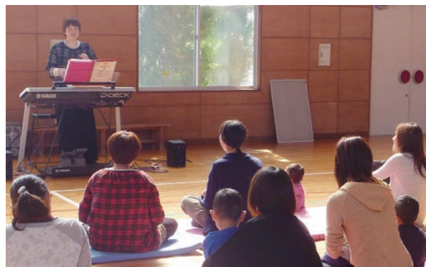
↑エレクトーンを演奏するボランティアの方

子育て支援センターでは、たくさんのボランティアの方が活動しています。例えば、イベントの際に、ピアノやエレクトーンで童謡やクラシックを演奏したり、サンタクロースに扮して、子どもたちにクリスマスプレゼントを配ったりと、さまざまな場面でご協力いただいています。センターでは、子どもや保護者の方と、地域の