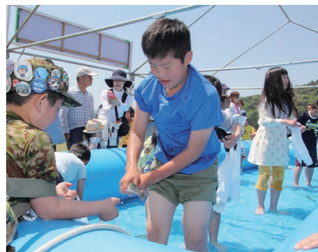
↓人気のニジマスつかみ取り

5月1日に、地区の安泰と五穀豊穡を祈願する例大祭が弥美神社（宮代）で行われました。 午前には、「幣押し」が行われ、宮代区、中寺区、小三ヶ区の男衆が大御幣をめくり激しいもみ合いを繰り広げました。 夕方には、赤い装束に鼻高の面と鳳凰の冠を身に付けた舞い手が「王の舞」を優雅に奉納。その後、上野区の獅子舞が境内を大暴れし、訪れた観客の笑いを誘いました。