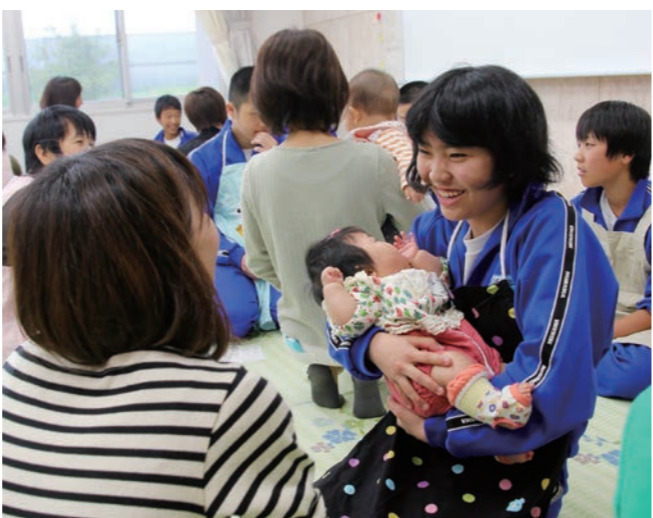
↓保護者に教わりながら赤ちゃんを抱っこする美浜中学生

5月7日に、国吉城まつりが若狭国吉城歴史資料館で行われました。 この催しは、国吉城とその周辺地域の歴史や自然を楽しんでもらおうと佐柿区が毎年開催しているものです。 当日は、国吉城址を通る御嶽山登山や写真展、講演、ジャズの演奏、国吉うどんの振る舞い等が行われ、来場者は歴史のロマンを感じていました。