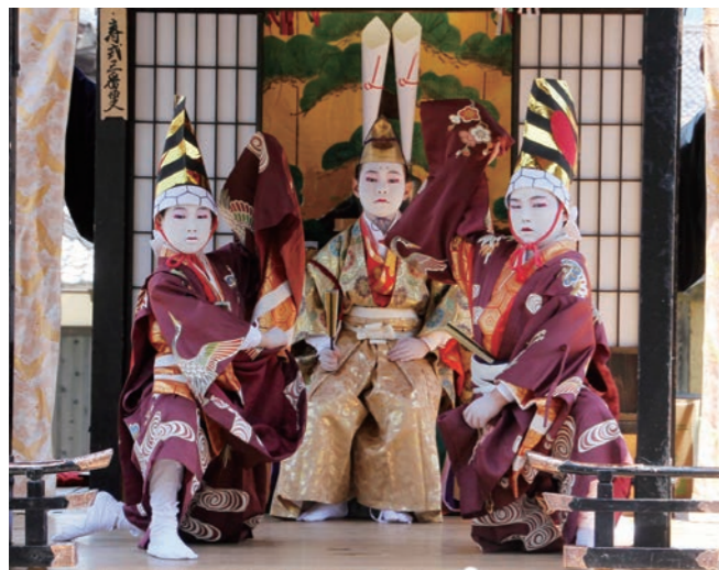
↓町の無形民俗文化財に指定されている「子供歌舞伎」