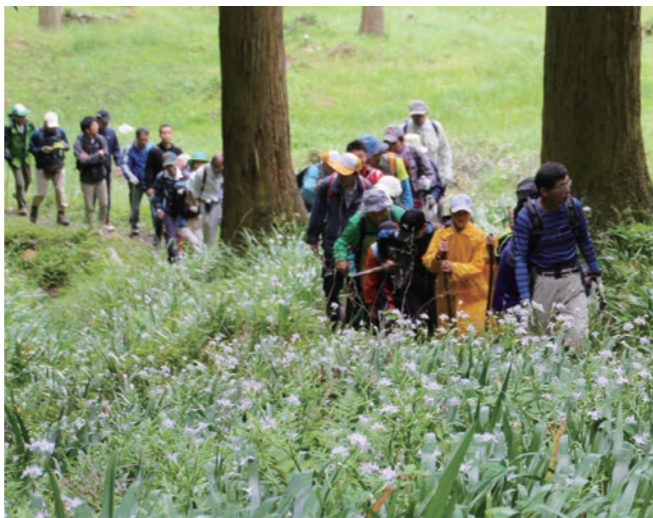
↓シャガの花が咲く登山道を歩く参加者

5月11日に、織田神社（佐田）で例祭が行われました。 午後1時より、佐田区の青年たちが神輿を担いで区内を練り歩いた後、神社に納めると、舞台では、佐田区の小学生による「王の舞」、太田区による「獅子舞」が堂々と披露されました。その後、山上区の袴姿の3人による「そっそ舞」が奉納され、舞と大きな唱え言葉の発声が祭を締めくくりました。