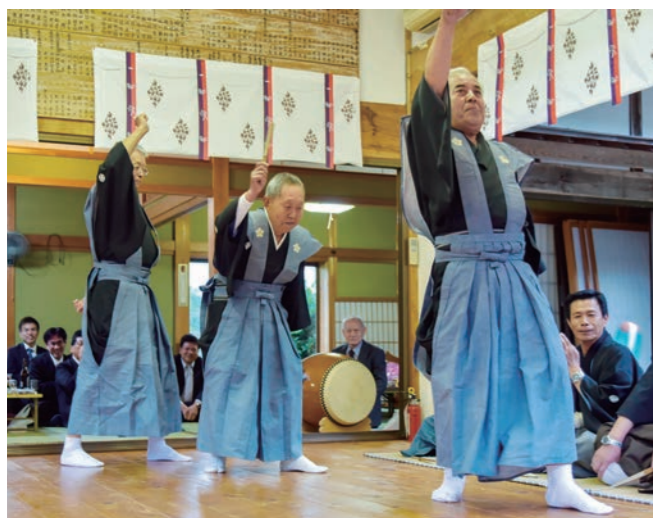
↓扇子を持ち大股で舞台を周る「そっそ舞」

5月5日に、日吉神社（早瀬）で山王祭礼が行われ、「子供歌舞伎」が奉納されました。 当日は、午前8時から曳山が区内を巡行。日吉神社前に着くと、化粧を施しきらびやかな衣装をまとった子ども役者による「寿式三番叟」が上演されました。 豆役者が、凛とした表情で力強く見栄を切ると、観客から多くのおひねりが投げ込まれました。