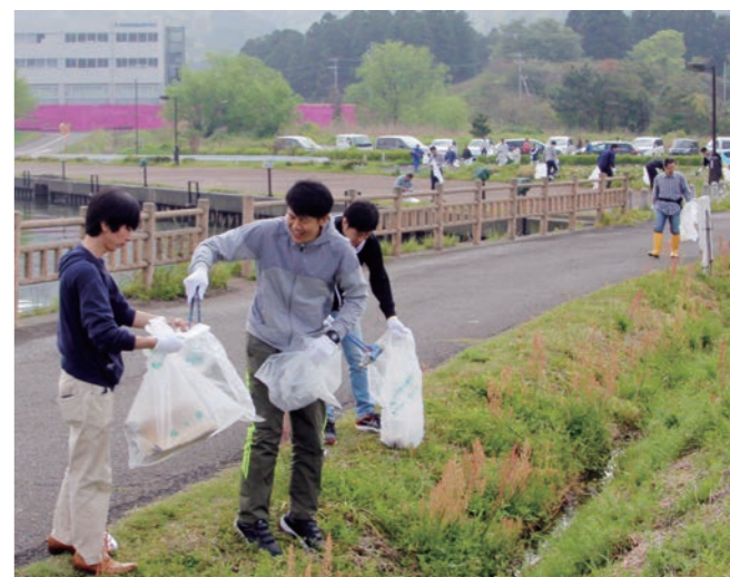
↑久々子湖沿いの道路に捨てられたごみを拾う参加者

5月3日から5日にかけて、第12回若狭路わんぱくフェアが総合運動公園で開催されました。 会場では、ニジマスのつかみ取りやバブルサッカー、特設ステージでのダンス、キャラクターショー等が行われました。また、隣接する久々子湖では、カヌーやウォーターバルーン等が行われ、訪れた子どもたちは元気いっぱい体を動かしていました。