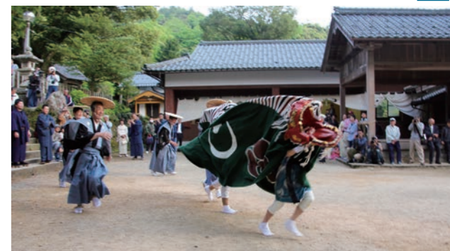
↑警護役を振り払い境内を走り回る獅子舞