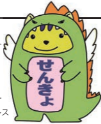
めいすいサウルス

みんなで投票。あなたの一票大切に! 今回の選挙から、選挙権年齢が 「満18歳以上」となります。