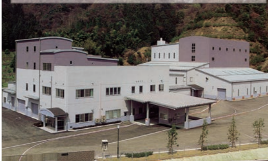
↑エコクル美方(右奥がガス化溶融施設)

エコクル美方「ガス化溶融施設」の平成27年度の稼働実績は、定期修繕工事等に伴う約2か月の運転停止期間はありましたが、当初の年間運転計画に基づいて予定どおり運転を続けることができました。 今後も、町民の皆さんに安心して利用していただけるように、施設の運転管理業務委託会社と十分に連絡調整を行いながら、施設の安全運転に努めていきます。 この度、平成27年度に実施しました排ガスの測定結果がまとまりましたのでお知らせします。 測定結果については、すべての項目において法排出規制値を下回り、安全な運転状況を確認しています。