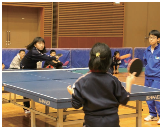
↓ 鋭いスマッシュを打つ児童