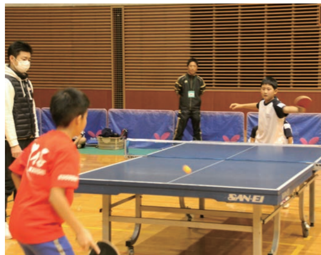
↓ 激しいラリーを繰り広げる児童たち