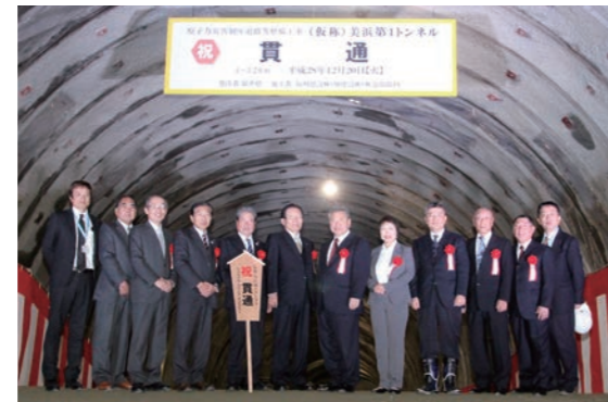
↑美浜第1トンネル貫通式

12月20日に、原子力災害制圧道路(仮称)美浜第1トンネルの貫通式が同トンネル内で開かれました。本道路は、国道27号から原子力発電所までの道路を多重化し、原子力発電所での事故発生時等に迅速な初動・事故の制圧等を行うため、福井県が整備しているものです。本道路上には、3つのトンネルがあり、今回貫通した美浜第1トンネルは、北田と菅浜を繋ぐ全長3,200メートルのトンネルです。