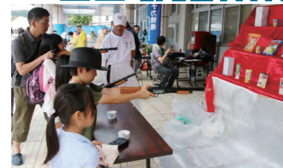
↑駅前のスペースに設けられた射的

会場では、射的や七夕の笹飾り作り、パンや大判焼き等の販売、オカリナやギターの演奏等が行われ、多くの人たちで賑わっていました。