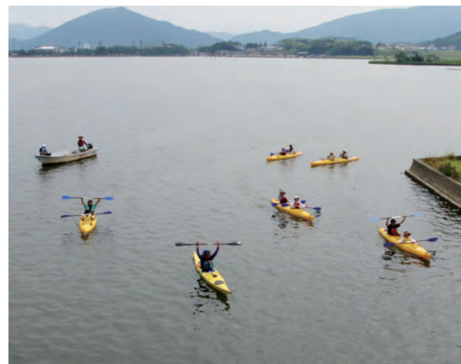
↓浦見川入口に到着する参加者