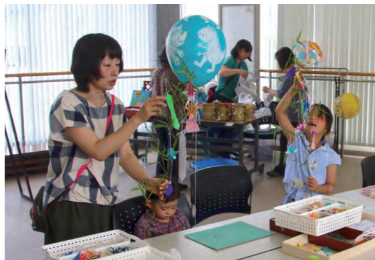
↓七夕の笹飾り作り