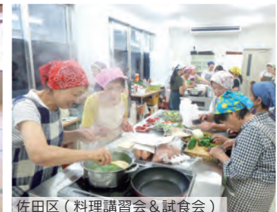
佐田区 (料理講習会&試食会)

各集落の健康づくり推進員を中心にさまざまな活動が行われていますので、区民の皆さんはぜひご参加ください。 町では、随時さまざまな健康相談をしているほか、塩分計や啓発DVDの貸し出しも行っています。推進集落以外の集落や団体の方もご利用いただけますので、気軽に健康づくり課までご連絡ください。