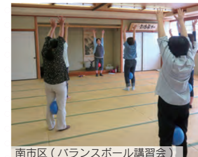
南区 (バランスボール講習会)