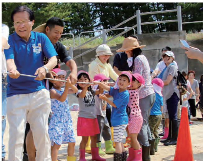
↓山口町長と一緒に地引網のロープを引く園児たち

コンサートは2部構成で、「コンドルは飛んでいく」やオリジナル曲の「大黄河」等の楽曲が披露されました。種類によって出る音の高さが違うオカリナを使い分ける演奏に、訪れた観客約370人は盛大な拍手を送っていました。