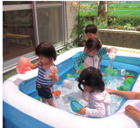
↑水をはったビニールプールで遊ぶ子どもたち