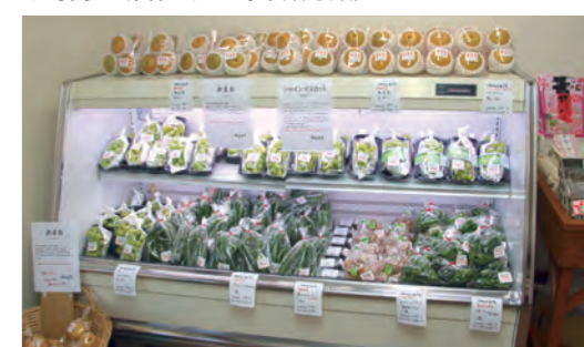
↓町内で栽培された野菜類も販売