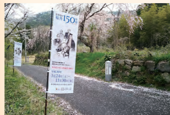
↑ 150年博幟が翻る准藩士屋敷跡

批判する人々は、朝廷(天皇)を尊び、諸外国を打ち払う「尊王攘夷」を旗印に、幕府を支持する「佐幕」派と激しく対立するようになりま す。一方、福井藩主松平春嶽等は、朝廷と幕府が一体となって難局に当たろうという「公武合体」を模索します。その三つ巴の動乱に佐柿も関わっていくのです。 元治元年(1864)、尊王攘夷実現のため、常陸国筑波山で挙兵した水戸天狗党(水戸浪士)は、関東を脱して京都に滞在する一橋慶喜(水戸藩出身、後の第15代将軍徳川慶喜)に訴えるため、京都を目指しますが、幕府軍の追撃を受けて越前国敦賀の新保宿で加賀藩に降伏しました。この時、小浜藩は敦賀包圍の兵の他、佐柿陣屋に後詰の兵を配置していました。 幕府に引き渡された水戸浪士らは、苛烈な扱いを受け、慶応元年(1865)、首領の武田耕雲斎以下353名が斬首となり、137名は遠島、その他は水戸藩預けや追放の処分が下りました。 遠島の者は、敦賀で謹慎していましたが、翌年沙汰済み(中止)となり、小浜藩に預けられました。藩では、浪士らを藩士同様に扱い(准藩士)、佐柿陣屋の門前に屋敷を新築して移しました(准藩士屋