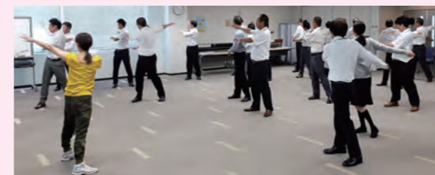
↑ラジオ体操の正しい姿勢や体の動かし方を学ぶサポーター企業の社員

げんげん歩楽寿サポーター企業の関電プラント株式会社原子力事業本部を訪問し、運動やげんげん歩楽寿の情報共有等を行いました。今後も、企業・団体と一体になって、げんげん歩楽寿に取り組めるよう情報共有していきます。