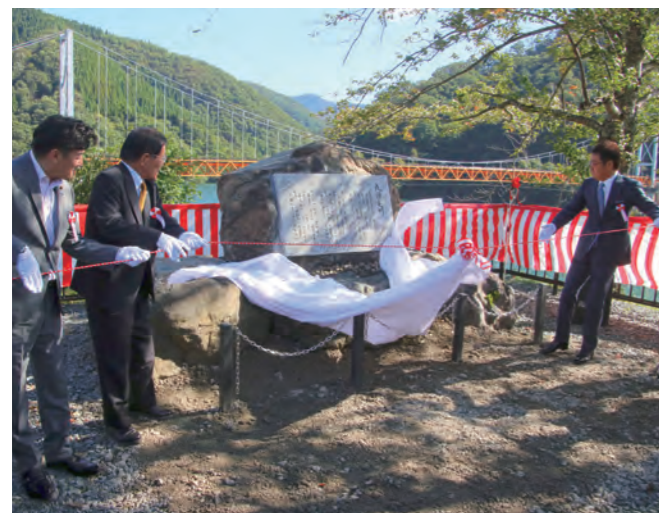
↓歌碑の除幕を行う五木ひろしさん(右)と参加者たち