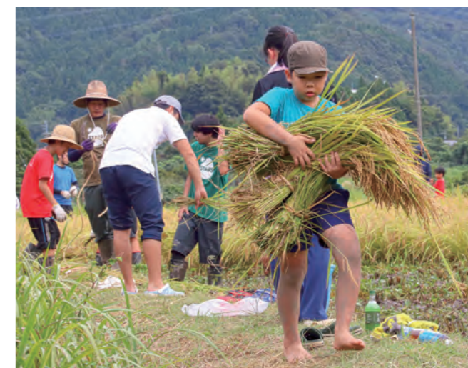
↓刈った稲を運ぶ子どもたち

9月23日に、三方五湖保全対策協議会主催による清掃活動が久々子湖と日向湖周辺で行われました。当日は、町内外の団体や生徒ら約370人が参加し、それぞれの持ち場に別れて久々子湖周辺のごみを拾いました。この日の清掃活動により、可燃ごみ約380kg、不燃ごみ約120kgを回収しました。