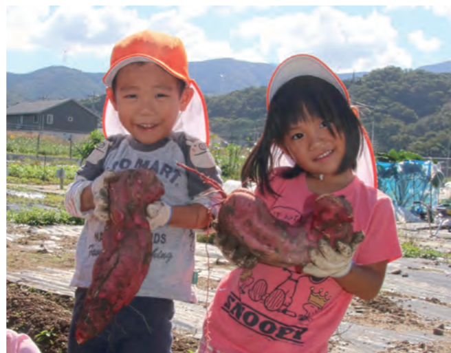
↓掘り起こした大きなさつまいもを持ち上げる園児たち

9月15日と16日に、きいばすフェスタがきいばすで開催されました。会場では、9DVR体験や、バッテリーカーや走るライト等の工作体験、「黒ラブ教授」や「らんま先生」によるサイエンスショー等が開催されました。来場した親子約2,400人は、それぞれのイベントに参加し、「遊び」と「学び」を体験していました。