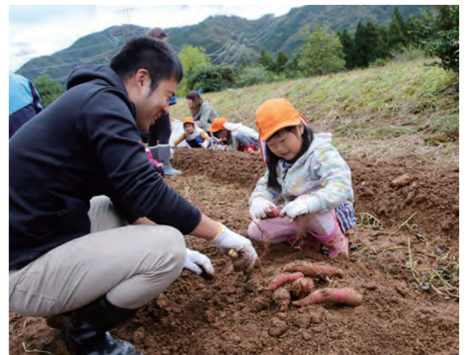
↓たくさんのさつまいもを掘る園児と保護者

10月21日に、福井RUN伴IN美浜が美浜駅から町役場にかけて行われました。この取り組みは、地域住民と認知症の方、施設関係者等がタスキをつなぎ喜びや達成感を共有することで、認知症の方に対する理解促進を目的に行われたものです。ランナーは、約80人の方の応援を受けながら、町役場までの道のりを歩いていました。