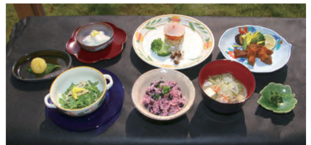
↓料理には町内で栽培された野菜類も使用