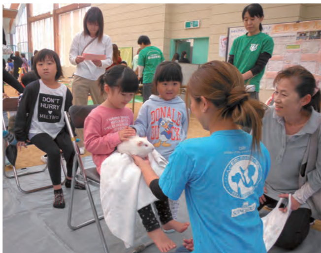
↓小動物と触れ合う参加者

滋賀県と福井県の城跡等をのろしでリレーするイベントが10月21日に開催されました。のろしは午前10時に横山城跡(滋賀県長浜市)をスタート。10時32分に国吉城址からのろしが上がり、次いで資料館横からのろしが上がりました。参加者20人は、のろし体験を通じて、地域の歴史や文化について学んでいました。