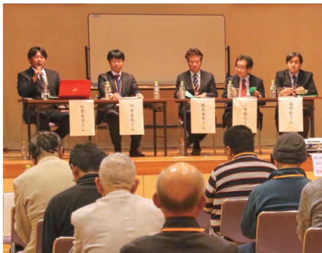
↓フォーラムの講師陣による座談会

10月26日から11月1日にかけて、敦賀交通安全協会による運転者講習会が町内4ヶ所で行われました。講習会では、交通事故防止に関するDVDの視聴や、敦賀警察署交通課による、交通安全についての講演がありました。参加者約220人は、講習をとおして交通安全に対する意識を高めていました。