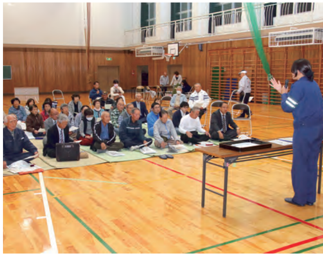
↓高齢者による事故について注意喚起する敦賀警察署交通課職員