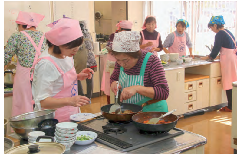
↓グループで協力して料理する参加者

10月28日に、福井県動物愛護フェスティバル2018がゆうあいひろばで開催されました。このイベントは、動物愛護に対する関心・理解を深めるため、県と(公社)福井県獣医師会が開催したものです。会場では、動物との触れ合い体験やペットの名札作り、動物クイズ等が行われ、来場者は普段触れないような動物との触れ合いを楽しんでいました。