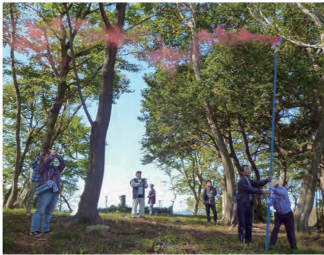
↓国吉城址でのろしを上げる参加者たち

11月3日に、美浜町歴史フォーラムがはあとびあで開催されました。今年度は、興道寺廃寺や各地の古代寺院の景観をテーマに歴史学、建築学、歴史地理学、考古学の専門家による講演と座談が行われ、活発な議論が展開されました。聴講者51人は、美浜町の古代文化に思いを馳せていました。