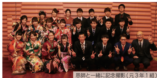
恩師と一緒に記念撮影(元3年1組)