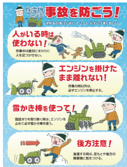
除雪機安全協議会 啓発チラシ