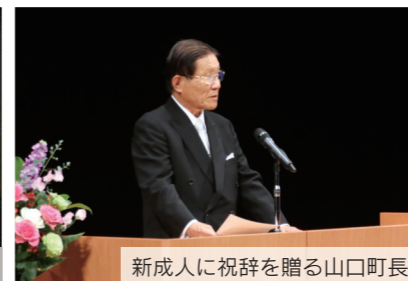
新成人に祝辞を贈る山口町長