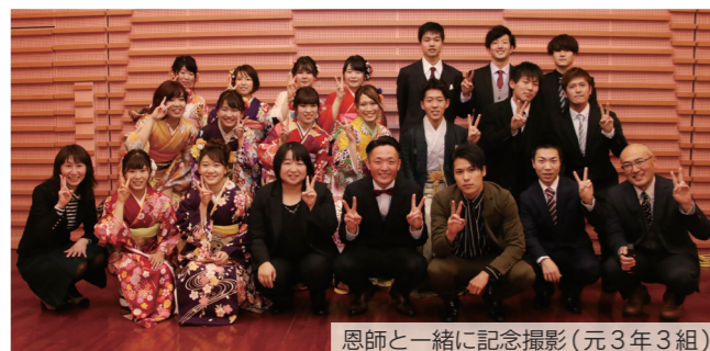
恩師と一緒に記念撮影(元3年3組)