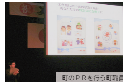
町のPRを行う町職員