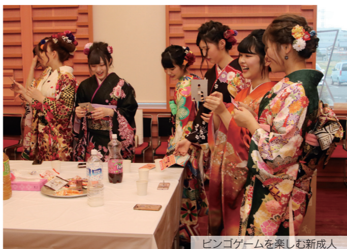
ピンゴゲームを楽しむ新成人