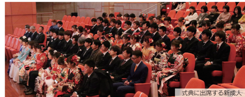
式典に出席する新成人