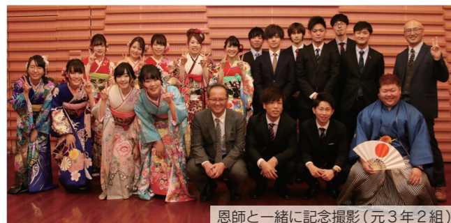
恩師と一緒に記念撮影(元3年2組)