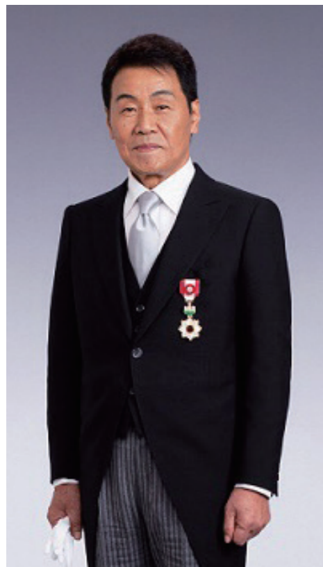
五木 ひろし 氏

平 成30年11月3日に、長年にわたり文化振興に貢献された功績が称えられ、歌手で美浜町の名誉町民の五木ひろしさんが旭日小綬章を受章されました。 五木さんは、昭和39年に第15回コロムビア全国歌謡コンクールで優勝し、歌手デビューされ、昭和46年には「よこはま・たそがれ」を「五木ひろし」としてリリースし、大ヒットを記録されました。 また、平成19年には紫綬褒章を受章され、今年、芸能生活55周年を迎えられます。