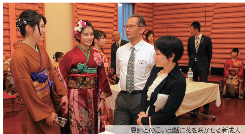
恩師との思い出話に花を咲かせる新成人