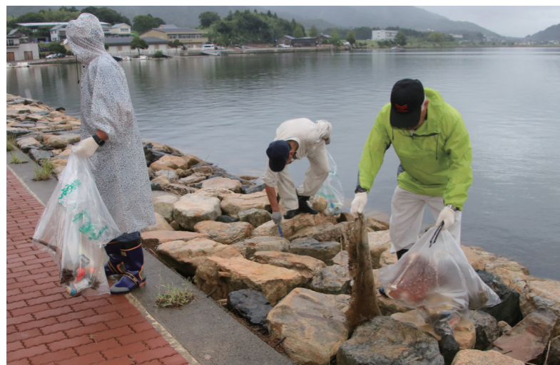
↓湖沿いのごみを拾う参加者