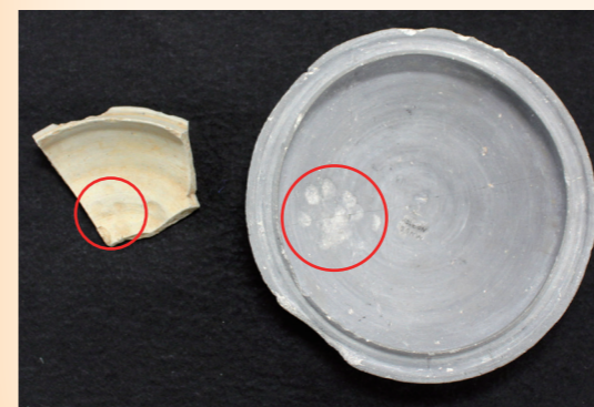
↑ネコ科と思われる足跡のついた土器 (左:興道寺遺跡出土、右:見野六号墳出土)

最古の猫の絵として有名です。日本の猫は、奈良時代に仏教経典等をネズミから守るために、遣唐使らによつて中国から経典とともにもたらされたのが始まりと考えられてきました。しかし、2008年にカラカミ遺跡(長崎県志岐市)から飼い猫と思われる大腿骨等の骨12点が出土したことにより、弥生時代(紀元前1世紀)から日本列島に存在していた可能性が指摘されています。 また、2007年には、見野六号墳(兵庫県姫路市)の東石室から、内側の底に小動物の足裏の肉球一つがはつきりとついた土器が見つかっています。爪の跡がなく、約3cmという大きさから、日本最古のネコ科の動物の足跡ではないかと注目されました。 そして、実は美浜町でも、2018年秋に行つた興道寺遺跡発掘調査にて、ネコ科の動物と思われる足跡がついた土器が見つかっています。見野六号墳での発見例と同じく、7世紀初め頃の須恵器杯で、内面の底に足跡が残っています。土器を生産していた窯場の近くで猫がウロウロし、窯で焼く前の乾燥中の土器を間違えて踏んじやつたということがわかります。