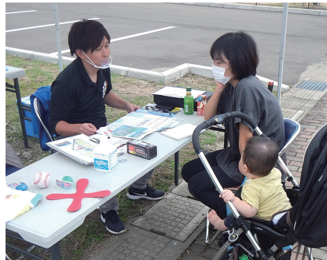
↓ 町職員からの説明を聞く来場者

9月23日にはあとぴあで、24日に町総合体育館でげんげん歩楽寿健康講座が行われました。同講座は、健康プログラム及び介護予防講座の一環として開催したもので、健診結果の見方講座や簡単な体操、ナイトウォーキング等を行いました。参加者らは、体操やウォーキングを行いながら、健康な体づくりに取り組んでいました。