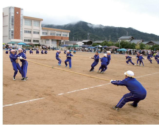
↓ 合図と同時に綱を取り合う児童 (美浜中央小学校・9月26日)